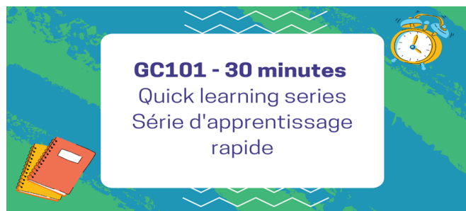
Figure 2 - Bannière de la série GC101