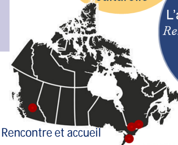
■ Rencontre et accueil

L'assemblée générale Rencontrez votre ombuds 1500+ SAC employés